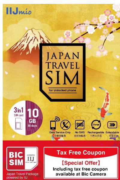
BIC SIM 版パッケージ