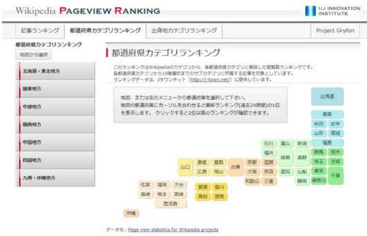
図2: IJ-II が公開する「Wikipedia ページビューランキング」

http://www.gryfon.ij-ii.co.jp/ranking/pref_ranking.php